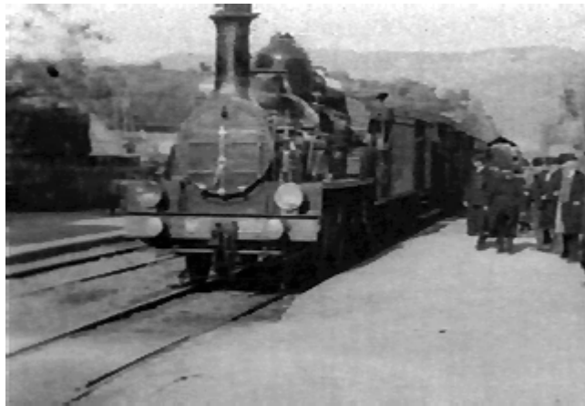
L'ARRIVEE D' UN TRAIN EN GARE (1895) (La Llegada del Tren), de los hermanos Lumiere

través del cine. La propia revolución rusa, que coincide con los primeros pasos del cine, dedicó un gran esfuerzo a la elaboración de propaganda desde este soporte. Por todo ello no es sorprendente que desde hace decenios el cine ha sido