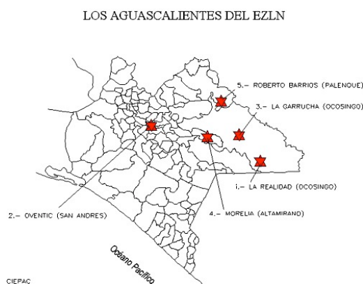
Distribución territorial de los pueblos autónomos zapatistas en el Estado de Chiapas.